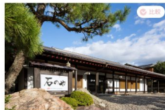
伊豆長岡温泉 (静岡県)