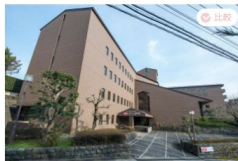
湯河原温泉 (神奈川県)

Wi-Fiを始めとして、会議室やホワイトボード、ワークスペースなど滞在中のワークをサポートするファシリティを用意したホテル・旅館。 ONSEN WORKのWebサイトに掲載する施設を中心にニーズに応じた施設を選び、プログラムとのパッケージでワンストップで提供します。